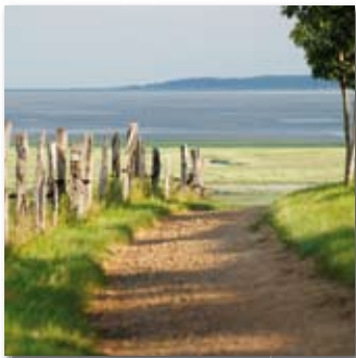
La Baie de Somme, une des plus belles baies au monde.

Les littoraux du nord de la France sont bien souvent méconnus. De Dunkerque à l'embouchure de la Seine, la Côte Picarde et la Côte d'Opale sont pourtant parmi les plus belles. Territoire naturel privilégié, ce littoral possède une grande diversité paysagère (dunes, falaises, plages...) et un terrain sablonneux. La situation géographique offre un climat maritime tempéré et une pluviométrie régulière, propice à une biodiversité abondante. Les terres intérieures ne sont pour autant pas en reste : leurs forêts, leurs marais et leurs prairies donnent vie à des paysages sauvages et foisonnants.